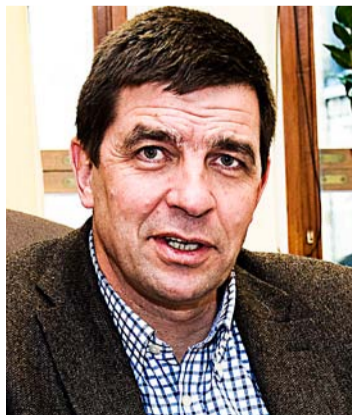
HØYRE-POLITIKER: Gunnar Gundersen.